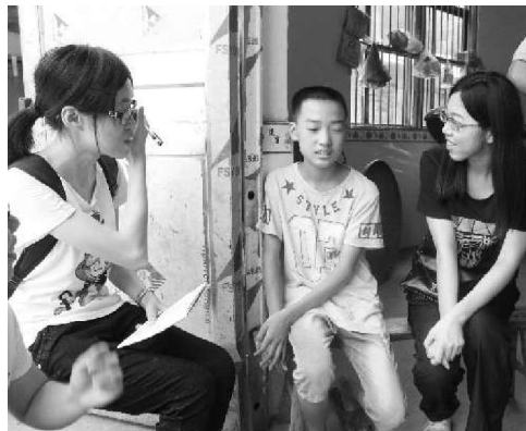
队员们和学校师生交谈

此次的三下乡调研活动,时间虽短,却让我们受益匪浅。像大庙口镇的特色农产业链,东安县的能源产业以及县里的农村学校等,更让我们对留守儿童的受教育情况有了更深的了解。