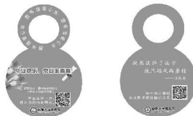
毕业墙与瓶口贴展示